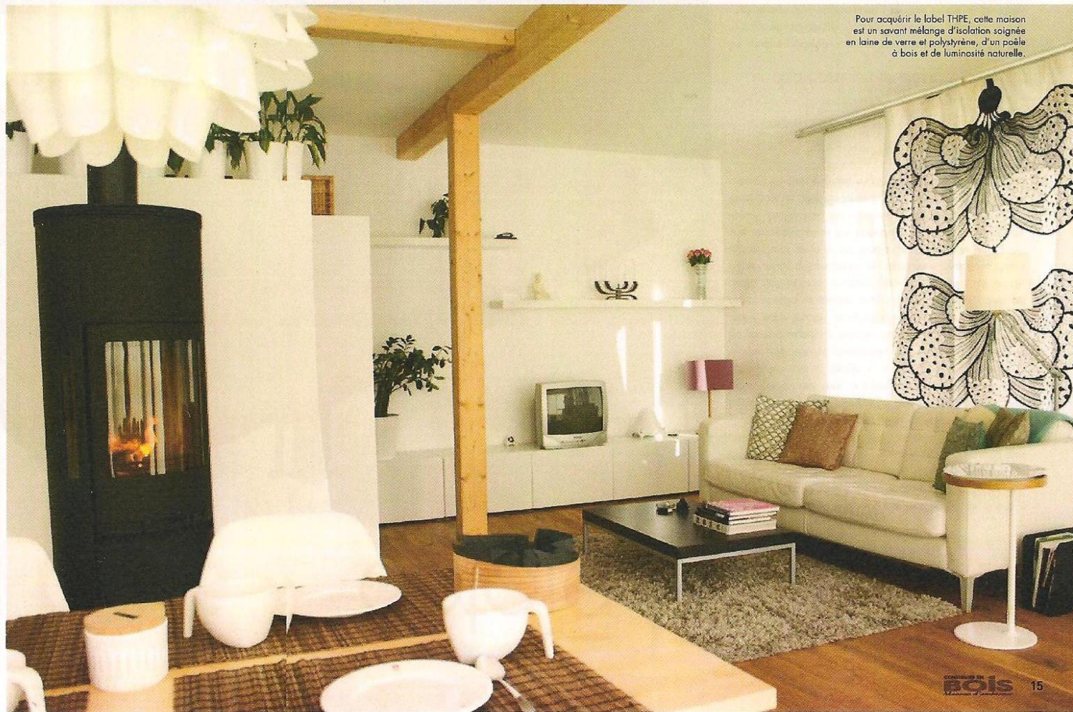
Pour acquérir le label THPE, cette maison est un savant mélange d'isolation soignée en laine de verre et polystyrène, d'un poêle à bois et de luminosité naturelle.