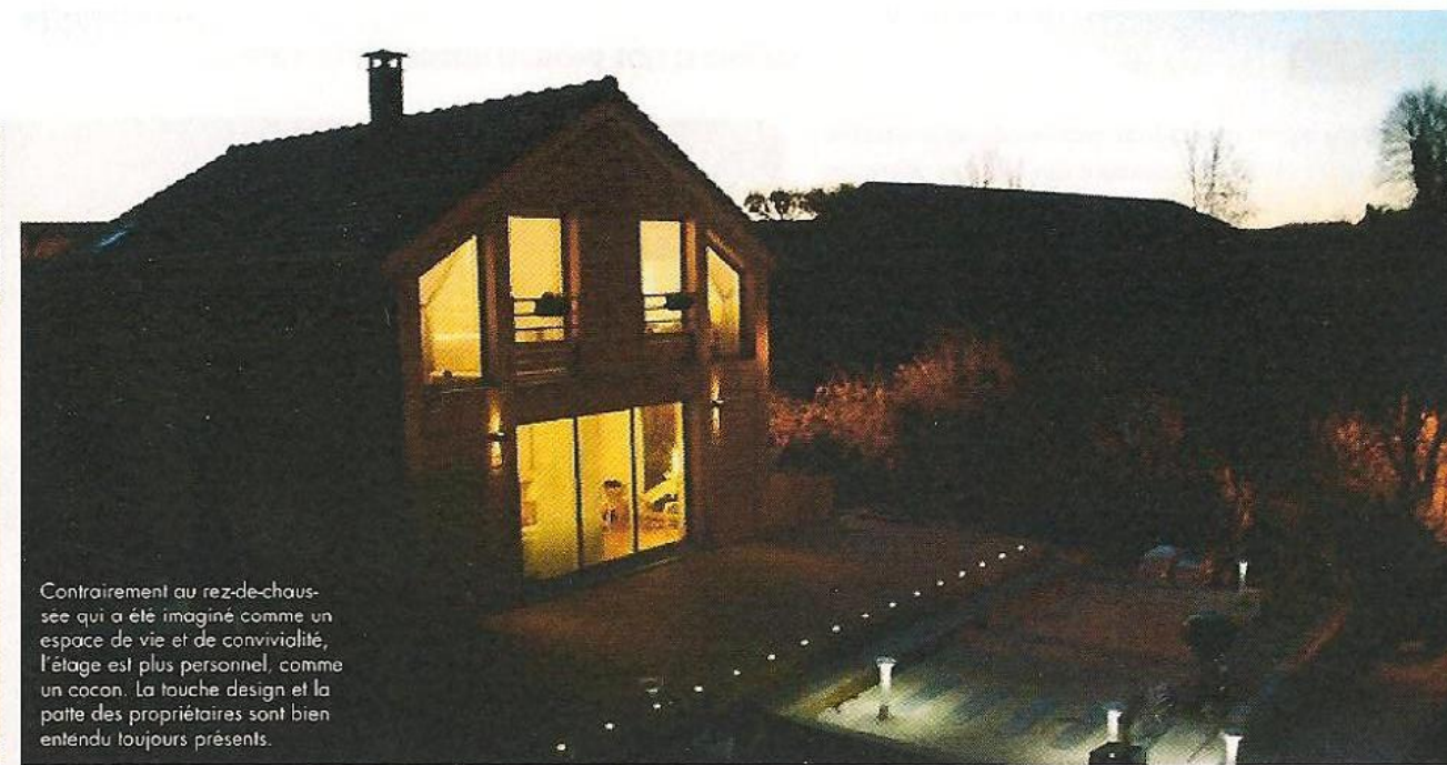
Contrairement au rez-de-chaussée qui a été imaginé comme un espace de vie et de convivialité, l'étage est plus personnel, comme un cocon. La touche design et la patte des propriétaires sont bien entendu toujours présents.